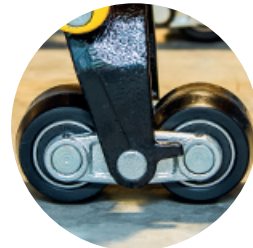
RUEDAS MONTADAS EN EJE BALANCIN.