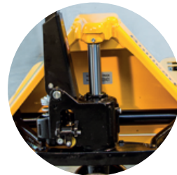
BRAZO CON DISEÑO TRIANGULAR.

*SOLO PARA LA BOMBA HIDRÁULICA (NO FRIGORÍFICOS NI AGUA).