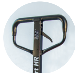
TIMÓN DE MANEJO CONFORTABLE.