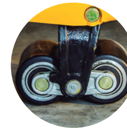
RUEDAS DE ACERO RECUBIERTAS DE POLIURETANO