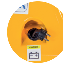
CARGADOR AUTOMÁTICO INCORPORADO