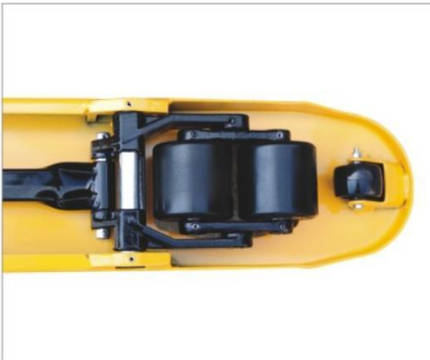
Rodillo de entrada para una fácil operación, innovador marco de la rueda