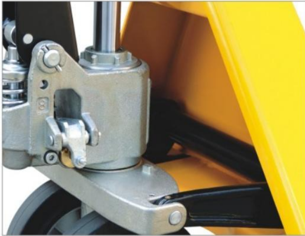
Tapa de la bomba regulable