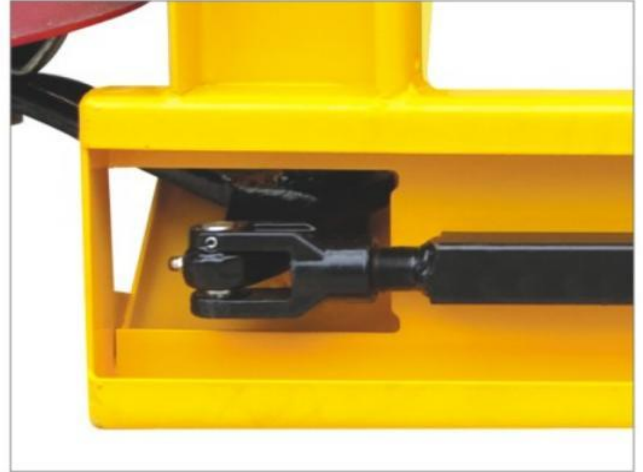
Empujador recto ajustable