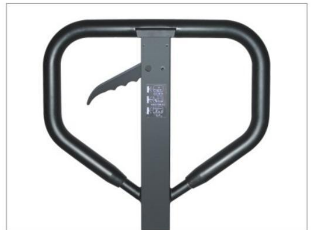
Opcional: Mango envuelto totalmente de goma

Observación: El tamaño especial para la anchura y la longitud se puede hacer según el requisito de cliente.